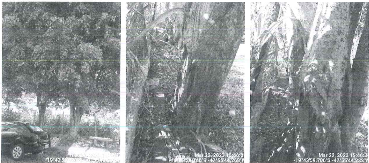
Figura 1 – Vista das figueiras comprometidas.

Durante vistoria, foi possível verificar 02 (duas) figueiras ( Ficus sp.) que apresentam desequilíbrio da arquitetura de copa voltada para a via, danos na base do coleto no lado oposto com evidências de queimada e biodeterioração, além de casca inclusa (ponto de ruptura).