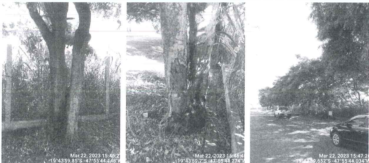
Figura 2 – Vista das figueiras comprometidas e os espécimes a serem podados.